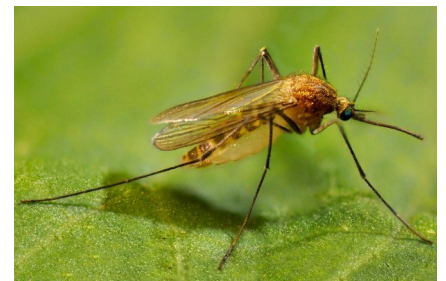
Culex pipiens -zanzara "COMUNE"

Questa misura di sostegno STRAORDINARIA è stata messa in campo per le zone pesantemente colpite dall'alluvione.