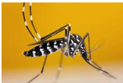
Aedes albopictus - zanzara TIGRE