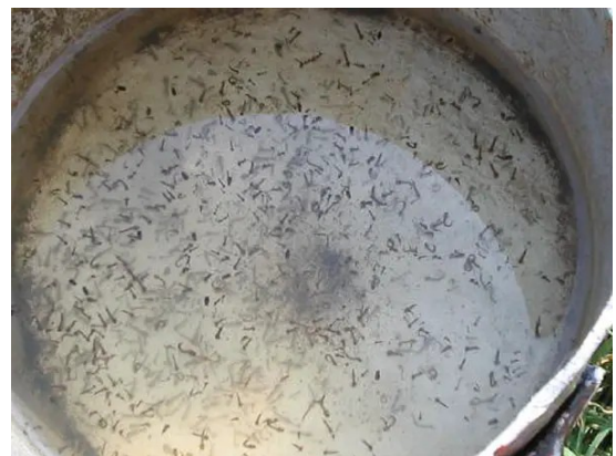
Secchio pieno di larve e pupe di zanzara